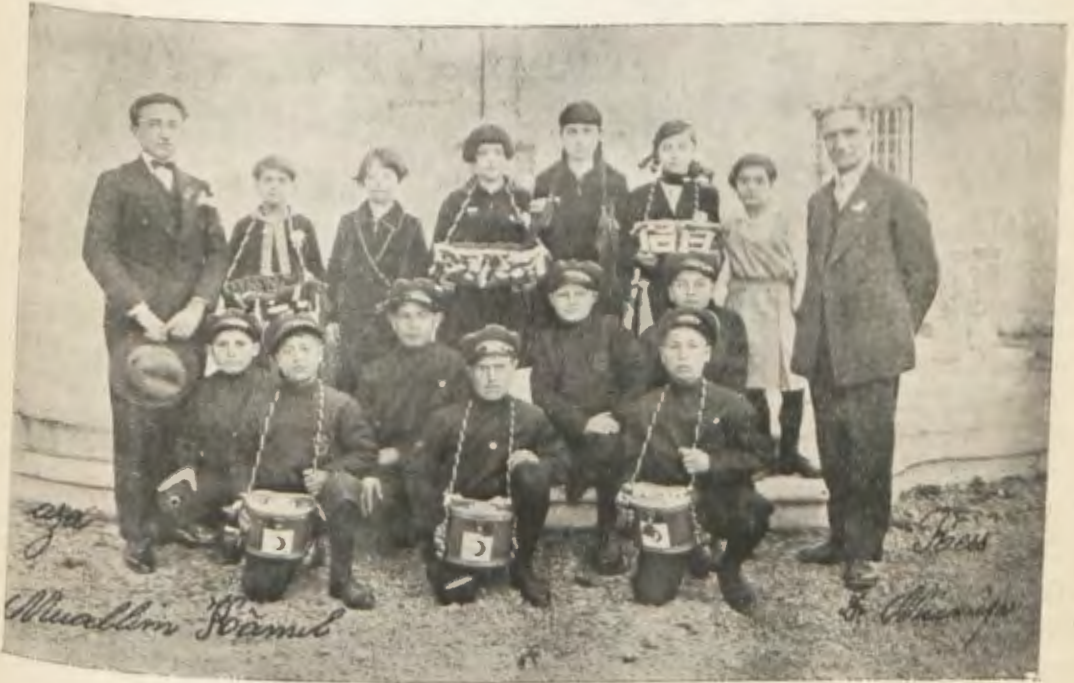
Ankara mülhakatından Gemlik Şubesinde bayram münasebetile rozet tevzi edenler