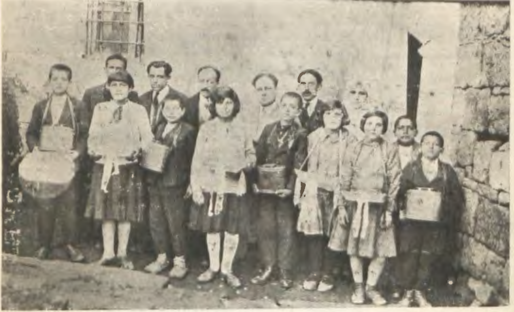
Bitlis Hilâliahmer merkezinde bayram münasebetile Rozet tevzi edenler

Nisan 1929 tarihli telgrafnamede Ayanek kazasında 1.000 kadar nüfusun çok muhtaç bir vaz'iyette bulduklarını bildirilerek muavenet talep edilmesi üzerine Ayancık Hilâliahmer Şubasının