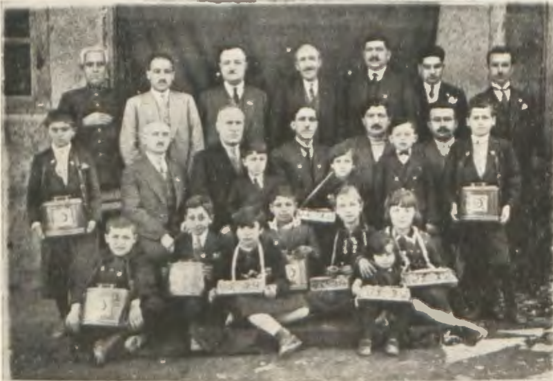
Tokat Hilâliahmer Merkezi 930 Çiçek günü hatırası

Vapurlara eşya götürmek, piyango tertip etmek, meşherdeki mağazasında ve İstanbul Merkez binasındaki yerinde satışına devam etmek suretile bu sene daha ziyade işlerini himaye etmeğe çalışacaktır. Ufacık teşkilâtile hayat vakfı vücut eden mütevazı müessesemizin başında senelerce bikelere yardımda hazduyan kıymetli hanım efendilerimizi taktir ve sakin mesailerinde muvaffakiyetler dileriz.