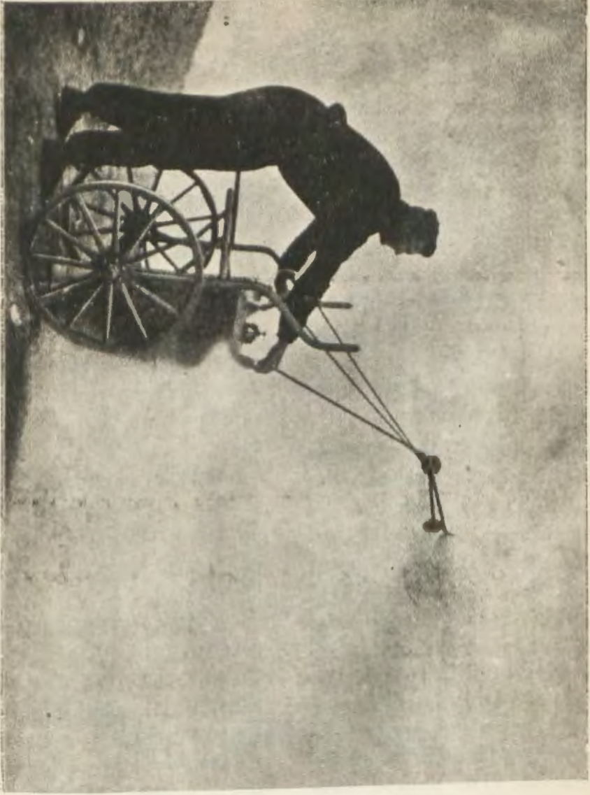
Dınman husule getiren alet

milleti müsellaha umdesi kabul olunduğu, ve 1914 felaketi, vesaiti tahribiyyenin daimi suretde terakkisi hasibiyle, daha ziyade şiddet ve vahamet kesp etmiş, olarak başlayıp hakem usuli için kabul olunmuş olan çarelere halkın emniyyet ve selameti hususunda ameli bir suretde te'min edilemediği takdirde geride bulunan sivil