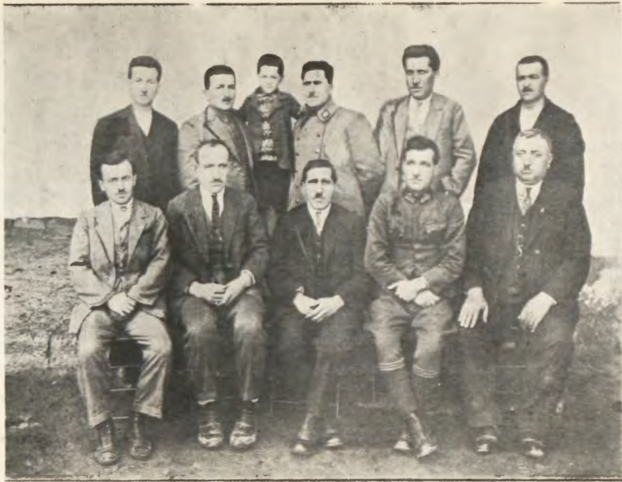
Sorgun Hilâliahmer Heyeti