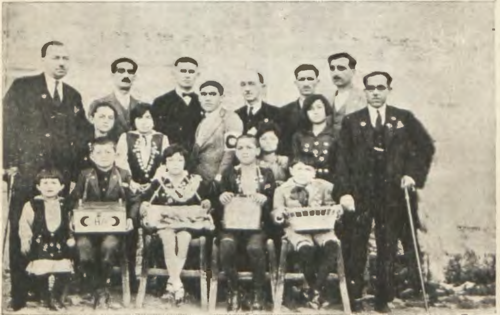
Gereze Hilaliahmer Şubesi Hey'eti İdaresi ve rozet tevzi eden yavrular