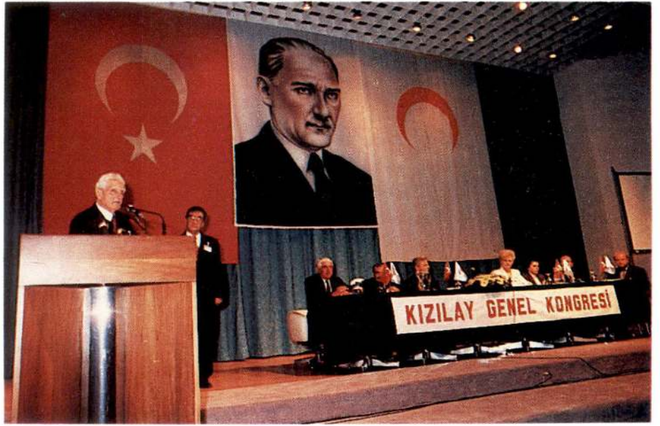
Genel Başkanımızın kongrede yaptığı konuşma sık sık alkışlarla kesildi.

Kızılay'ın gelirlerindeki artışlar tabii olarak yıllık bütçelerimizin daha fazla hizmet verebilecek bir seviyede düzenlenmesine imkân sağlamaktadır. 1996 yılı gelirleri bütçe tahminlerinin % 161 fazlasıyla gerçekleşmiş ve böylece de Kızılay'ın 1997 yılı bütçesi 1996 yılı bütçesine oranla % 130 bir artışla gelir ve gideri 12.047.449.000 TL olarak düzenlenmiştir. Kızılay Büyük Atatürk'ün Yurtta Sulh Cihanda Sulh ilkesi doğrultusundaki hizmetleriyle 1995 yılında sahip olduğu Atatürk Uluslararası Barış Ödülü'ne layık olmanın gereklerini 21. yüzyılda da başarı ile yürütebilmek için bir dizi hedefler saptamış ve bunların çalışmalarını