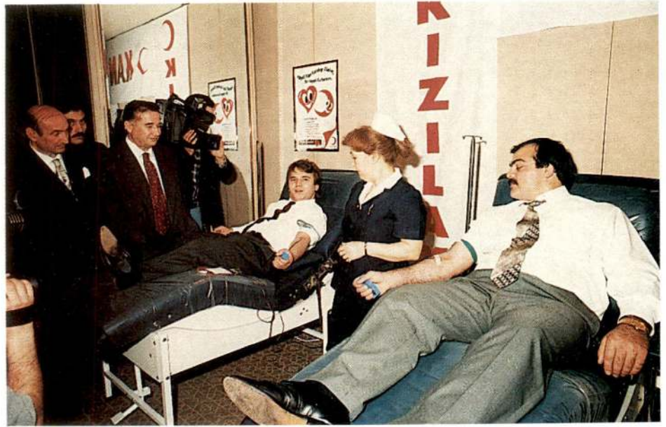
Hilton Otelindeki toplantıda da ilk kan bağışını olimpiyat ve dünya şampiyonu milli sporcularımız yaptılar.

"Belki mutlaka orda kan bulunacaktı. Belki yardımlarla kan toplanacaktı. Ama bunlar tesadüflere kalmış bir iş olacaktı. Biz millet olarak başımıza bir iş gelmeyince bunun kıymetini anlamıyoruz.