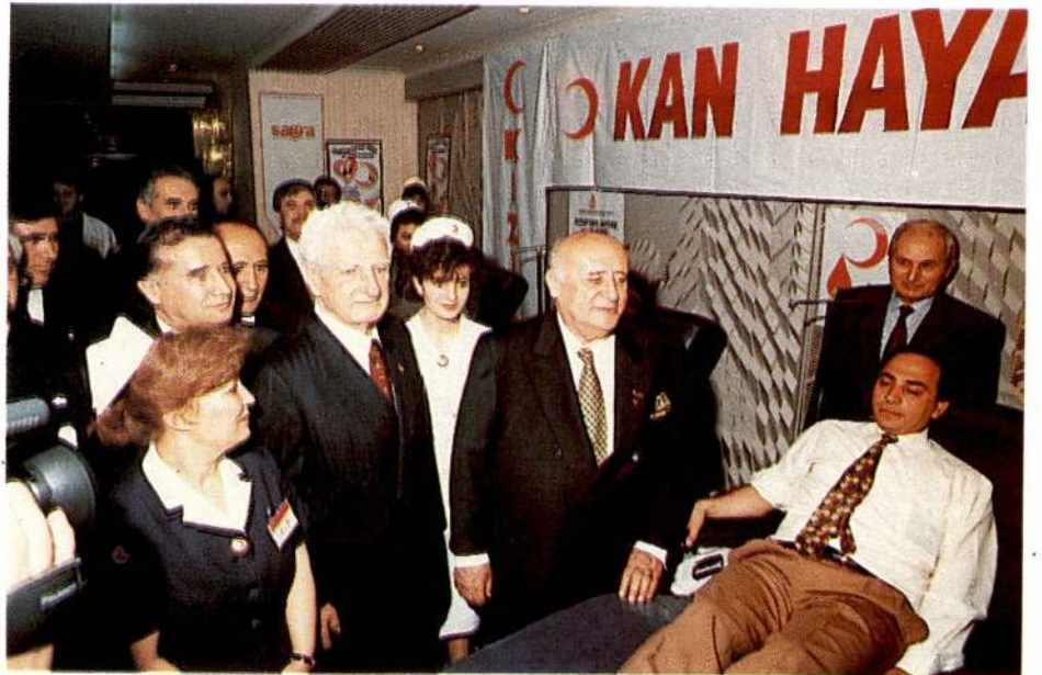
Cumhurbaşkanlığı personeli törenin ardından Kızılay ekibine kan bağışında bulundu.