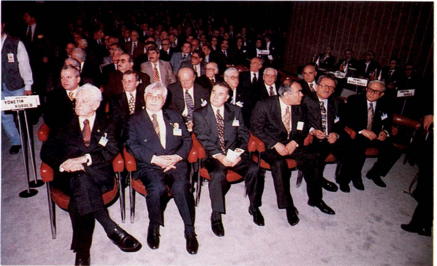
Kızılay Yönetim Kurulu ve Merkez Kurulu üyeleri kongre çalışmalarını izlerken.

Bu maksatla yola çıkanların Allah yardımcısıdır. Yine söylüyorum: Sizler gerçekten, bu hizmetleri yaptığınız için Allah'ın sevgili kullarısınız. Cenab-ı Allah bu hizmetlerde sizi başarılı kılsın, şevkinizi artırsın, gücünüzü artırsın, kudretinizi artırsın ve daha çok insana daha çok hizmet etmek imkânını sizden esirgemesin! Hepinize başarılar diliyorum ve sizleri sevgiyle selamlıyorum. Hoşça kalınız.