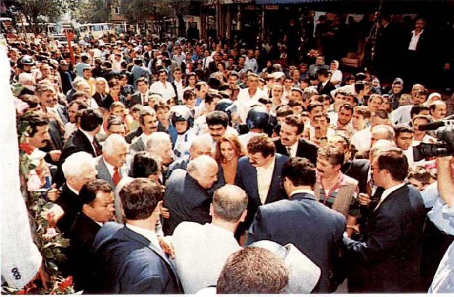
Cumhurbaşkanı Süleyman Demirel, Gaziosmanpaşa'da kalabalık bir vatandaş topluluğu tarafından büyük sevgi gösterileriyle karşılandı.

memleketlerinde nasıl okunuyorsa onları öyle okutacağız ki, dünyayla yarışmaya devam edebilelim. Dünyanın gerisinde olamayız."