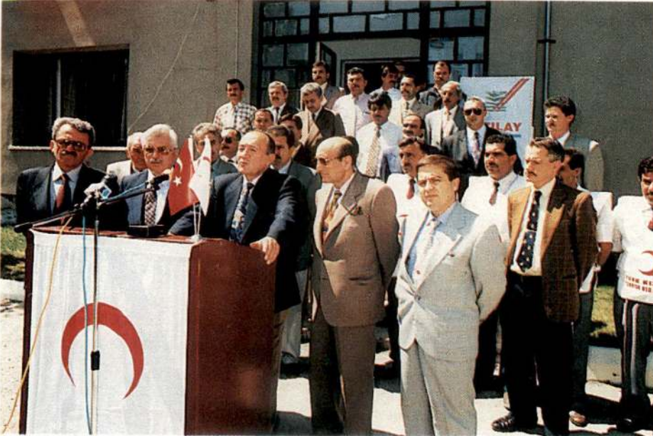
Yardım konvoyu törenle Arnavutluk'a uğurlandı.

K ızılay ekonomik zorluklar içinde bulunan Arnavutluk'a 8.250.000.000 TL değerinde 80 ton insani yardım malzemesi gönderdi.