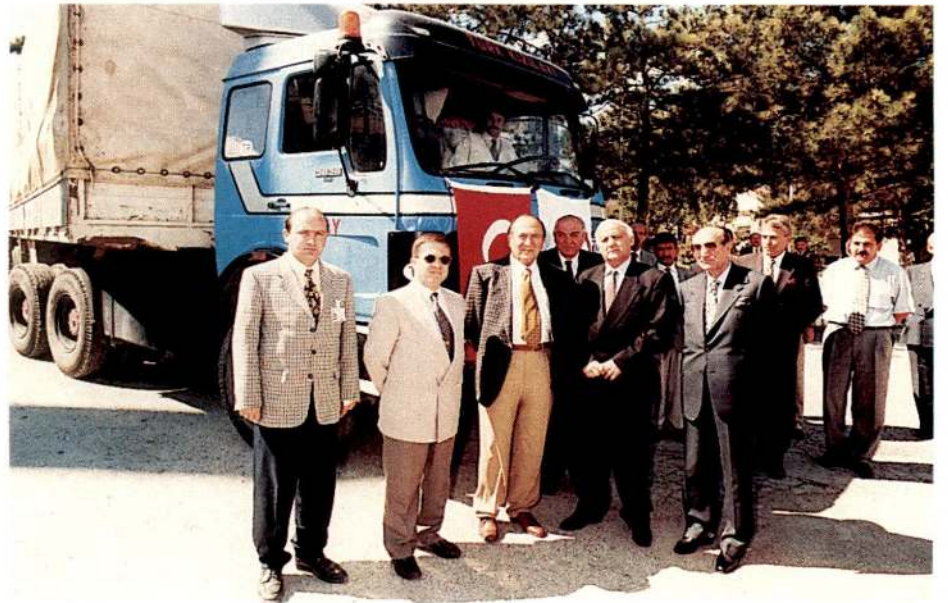
Büyükelçi Mehmet Aliyev de konuşmasında, Azerbaycanlıların bu yardımları unutmayacağını söyledi.

lerinin, Kızılay'a ait 2 TIR'la sevk edileceğini ve Azerbaycan Büyükelçiliğimiz aracılığıyla Azeri yetkililere teslim edileceğini bildirdi.