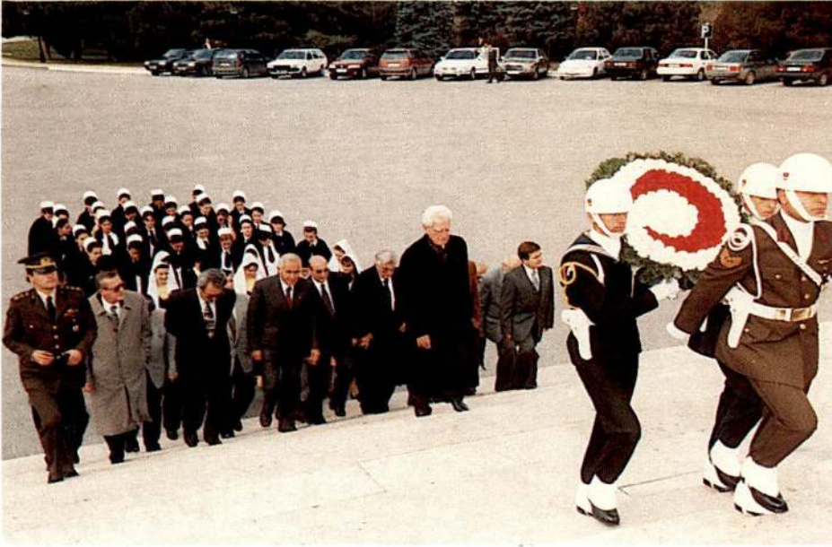
Kızılay'ın üst düzey yöneticileri Anıtkabir'de...