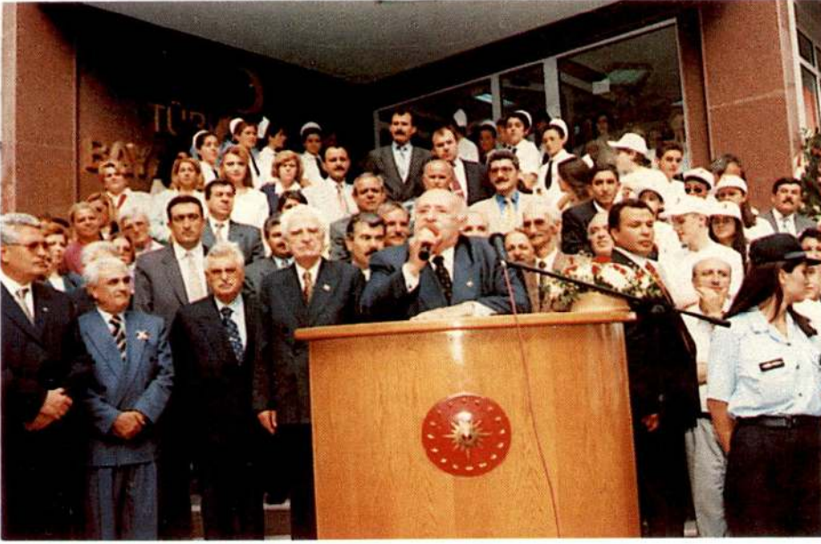
Cumhurbaşkanımız Bayrampaşa'da da aynı coşkuyla karşılandı.