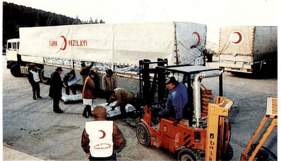
Yardım malzemeleri Bulgar Kızılayı yetkililerine teslim edildi.

Abdullah Gül , konuşmasını bu yardımın organizasyonunda emeği geçenlere ve Kızılay'a teşekkür ederek tamamladı.