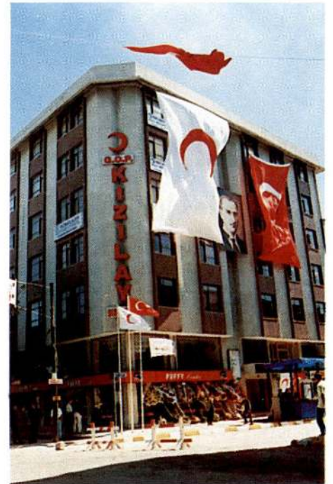
Kızılay Gaziosmanpaşa Dispanseri

"Sayın Cumhurbaşkanım, 75 yaşına geldim. Gaziosmanpaşa'ya tam 50 sene