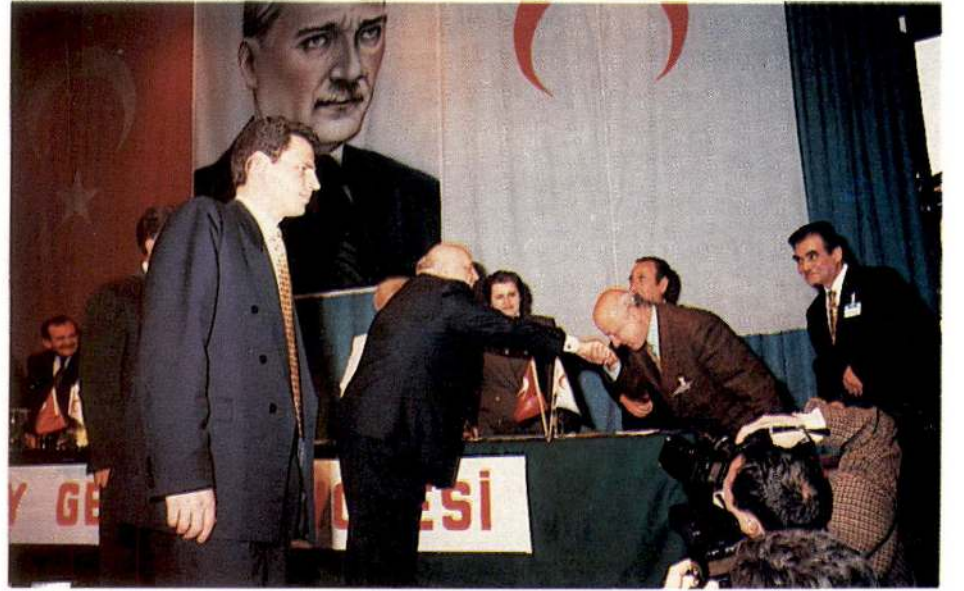
Cumhurbaşkanı Süleyman Demirel, Divan Başkanı ve üyelerini tek tek tebrik etti.

Bugün size ayrılan yere kadar zor geldiniz. Onlar size hep Kızılay'ı koruyan, onun üzerine kanat geren Devlet Başkanı, Cumhurbaşkanını olarak görmüşlerdir. Ben bütün yaşantımda, sizin siyasi