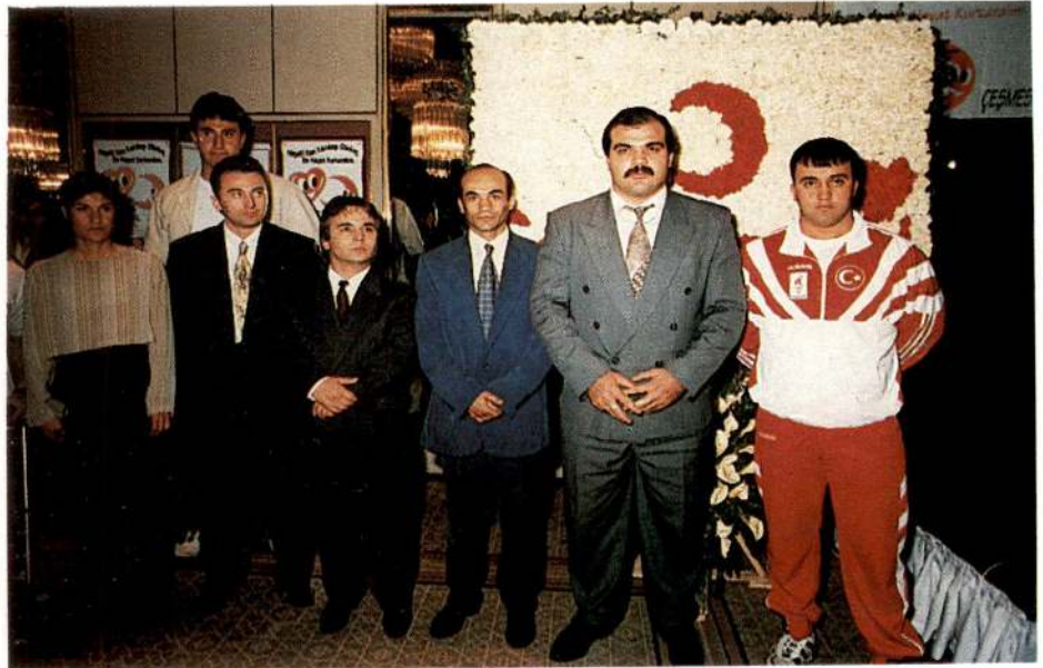
Milli sporcularımız herkesi kan bağışına davet ettiler.