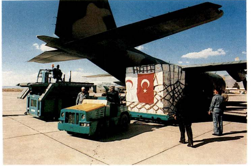
Kızılay yardımını götüren askeri uçak, Pakistan'ın Quetta Havaalanı'nda...

Etimesgut Depomuzdaki törene Kızılay'ın diğer üst düzey yöneticileri de katıldılar.