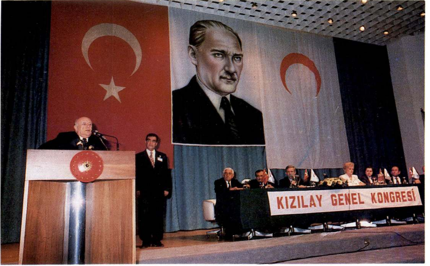
Cumhurbaşkanı Süleyman Demirel, konuşmasına başlamadan önce delegeler tarafından uzun süre ayakta alkışlandı.