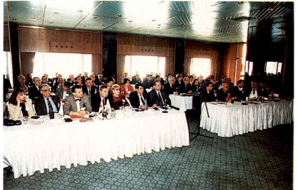
Konferansa 11 ülkenin ulusal derneklerinin temsilcileri katıldı.