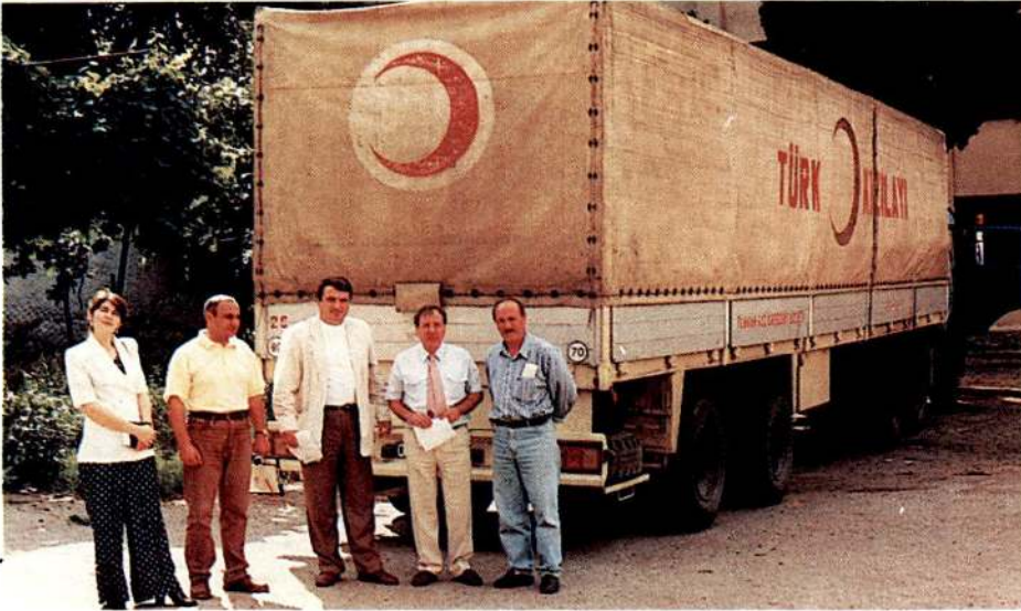
Yardım malzemesi yüklü aracımız Tiflis'te.

Kızılay bu yılın Mart ayı başında yine deprem nedeniyle İran'ın Erdebil Eyaleti'ne de karayoluyla, 18.250.000 TL değerinde 100 çadır, 3.500 battaniye, 75.00 enjektör ve muhtelif tıbbi malzeme göndermişti.