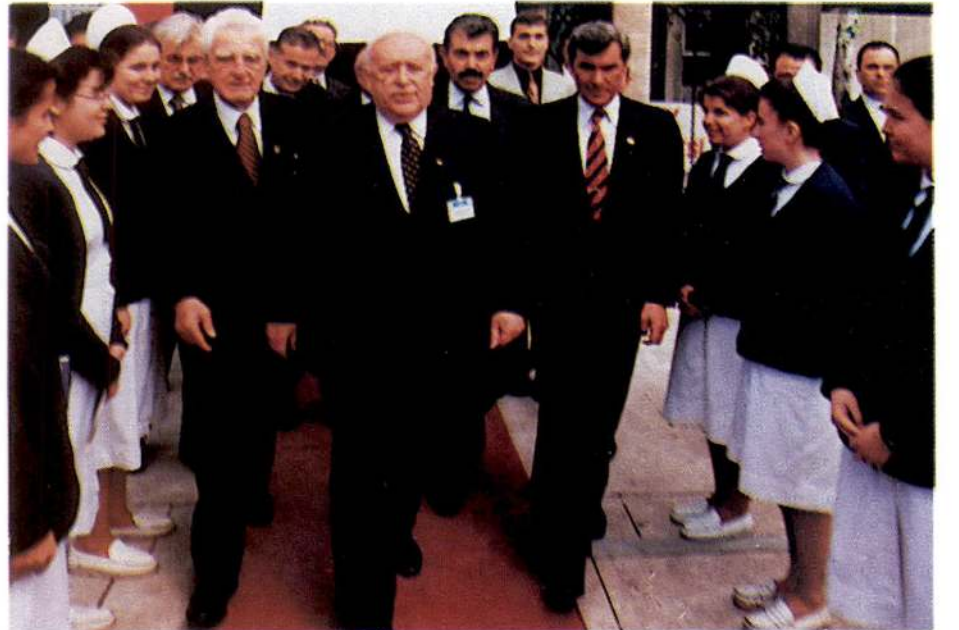
Cumhurbaşkanı Demirel, kongre salonundan alkışlarla ayrıldı.

Sayın Cumhurbaşkanım, bu Kızılaycılar, burada oturanlar, siz konuştuğunuz zaman hep gözleri yaşlı dinlerler sizi, hepimiz öyle. Bunlar, ülkenin değişik yerlerinden sıkıntılar içerisinde gelmiş arkadaşlarımdır. İnsana hizmetten başka hiçbir duygusu olmayan... Siyasi kanaatleri ayrı... Hangisinin hangi siyasi kanaat sahibi olduğunu da bilmem ben, ama bir tek şeyi biliyorum: Onlar Kızılaycı; her