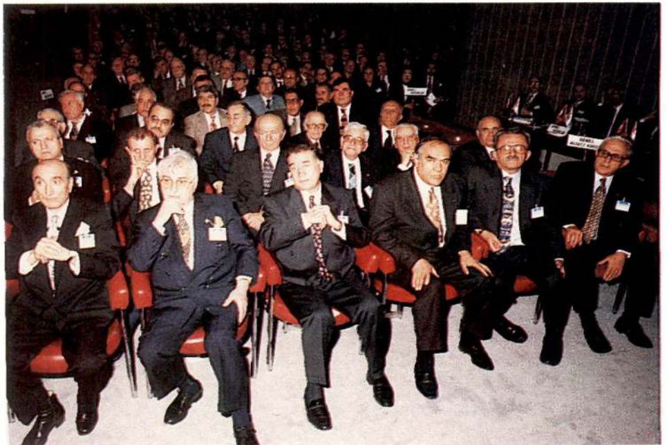
Yönetim Kurulu, Merkez Kurulu ve Denetçiler Kurulu üyelerimiz.

Sayın Cumhurbaşkanım, 2000'li yıllarda bölge ulusal dernekleriyle daha iyi bir işbirliği içerisine girmenin gereği açıktır. Karadeniz Ekonomik İşbirliği'ne dahil ülkelerin ulusal dernekleriyle yaptığımız Karadeniz Kızılağ - Kızılay Konferansı'nda, sizin arzu buyurduğunuz bir bölge deposunun kurulması konusu dile getirilmiş, ilgi görmüş; ancak, KEİ'ye dahil ülkelerin hiçbirinin -Türkiye hariç- ulusal derneğinin ekonomik gücünün yeterli olduğunu söylemek imkânına sahip değilim. Hepsi dar imkânlarla çalışan kuruluşlar. Böyle bir yükün altına girmek ba-