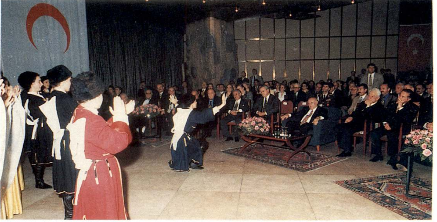
Kızılay'ın 130. kuruluş yıldönümü dolayısıyla Büyük Ankara Oteli'nde düzenlenen toplantıda, Hemşirelik Lisemizin Forklor Ekibi de halkoyunlarımızdan örnekler sergiledi.

den itibaren zaten almaya devam etmektedir.