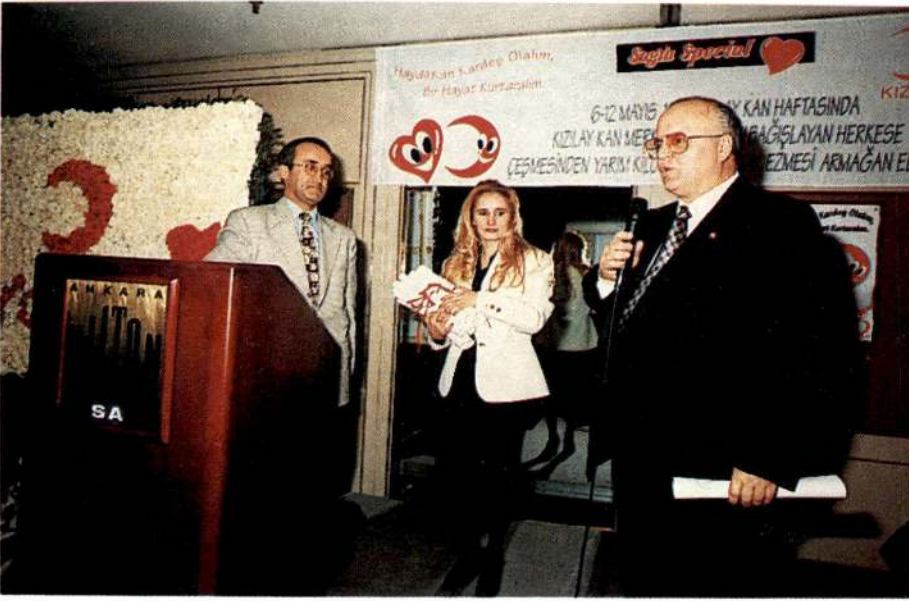
Kızılay'a belli sayılarda kan bağışlayan donörlerle törenle madalya ve plaket verildi.

dolayı Sağra ve Milli Piyango İdaresi'ne teşekkür etti.