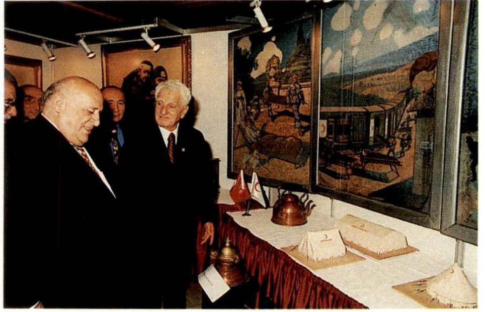
Cumhurbaşkanımız Süleyman Demirel, Ankara Otel'i'nde düzenlenen sergimizi de gezdi.

luk kazandığı 1990'lı yıllara baktığımızda, son 6-7 yılda değişik 44 ülkeye 329 seferde 314.300 ton insani yardım malzemesi gönderdiğimiz (yaklaşık 205 Milyon Amerikan Doları değerinde) ve bu yardımlar için 3202 TIR, 217 askeri nakliye uçağı, 59 gemi ve bir tren kullandığımız, 25 değişik ülkeye de para yardımı yaptığımız görülmektedir.