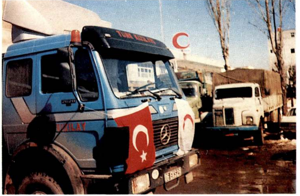
Yardım malzemeleri Erdebil'de Hilaliahmer yetkililerine teslim edildi.

Açıklamada, İran hükümetinin uluslararası yardım çağrısı üzerine hazırlanan 2 askeri uçak dolusu acil yardım malzemesinin, İran Hilaliahmeri'ne teslim edildi.