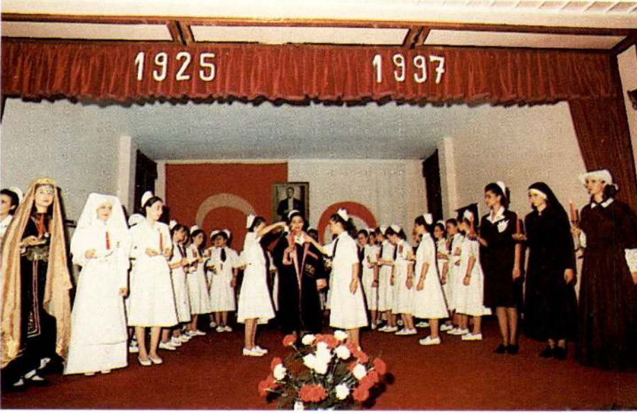
Keplerini giyen öğrenciler, geleneksel "ışık alma" törenine katıldılar.

yücüler tarafından görülmüş; fakat okuma-yazmanın başlamasıyla birlikte Babil, Sümer, Mısır, Hindistan, İran ve Çinlilerde bu meslek belirmiş ve ayrı bir saygınlık kazanmıştır" dedi.