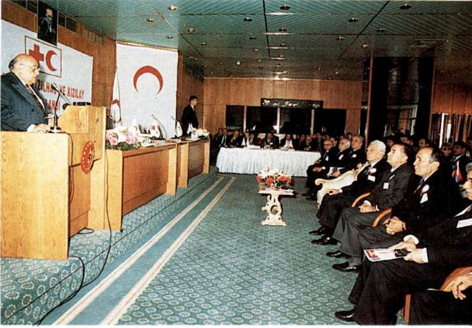
1. Karadeniz Kızıllaç - Kızıllaç Konferansı, Cumhurbaşkanı Süleyman Demirel'in açış konuşmasıyla başladı.