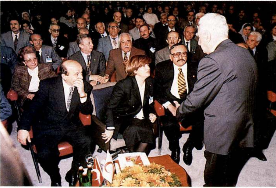
Başbakan Yardımcısı ve Dışişleri Bakanı Tanış Çiller Genel Kongremize ikinci gün katılarak bir konuşma yaptı.

Kızılay bugün uluslararası boyutta yardım alan değil, yardım veren kuruluşumuzdur. Herkese koşan Kızılay, din ayrımı gözetmeden, hiçbir ayrılığa kendini kaptırmadan, insanlık uğruna, yardımseverlik uğruna bir büyük anlayışla, bir büyük seferberlikle dünyada yerini alıyor. Yani Türkiye'nin her kurumunda uluslararası düzeye çıkma ve o düzeyde imkânlarını seferber etme çabası var.