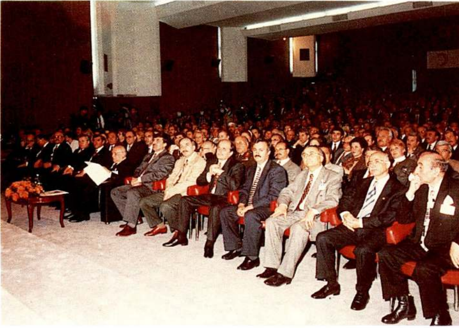
Cumhurbaşkanı Süleyman Demirel, davetliler ve delegeler...

tir. Yurtdışı yardımların bünyesinde, Hükümetimizin projelendirdiği uygulamaların katkıları, aziz milletimizin bağışları ve Kızılay'ın öz kaynaklarından kullandığı kendi doğal imkanları vardır.