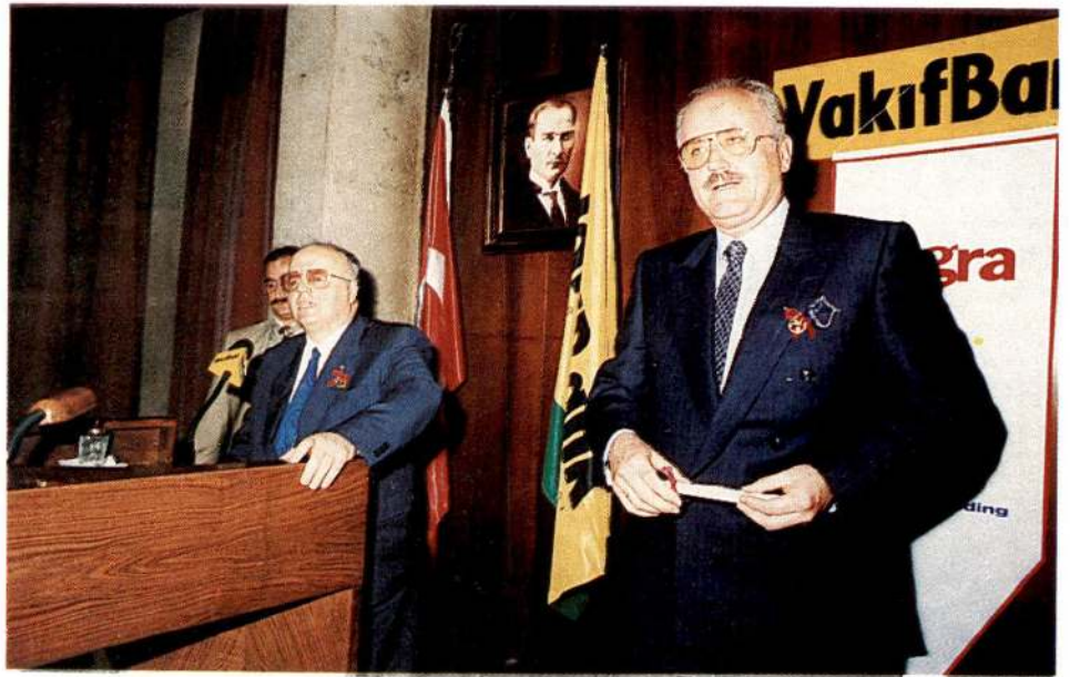
Altın madalya alan donörlerimizin arasında eski Sanayi ve Ticaret Bakanı Şükrü Yürür de bulunuyordu.

Bu toplantıların, donörlerin önerilerini almak bakımından ayrı bir önemi olduğunu belirten Ertan Gönen , yapılan çalışmalar sonucu kan bağışlarında her sene yüzde 10 oranında bir artış sağlandığını, buna rağmen toplanan kanların ülke ihtiyacının çok altında kaldığını söyledi.