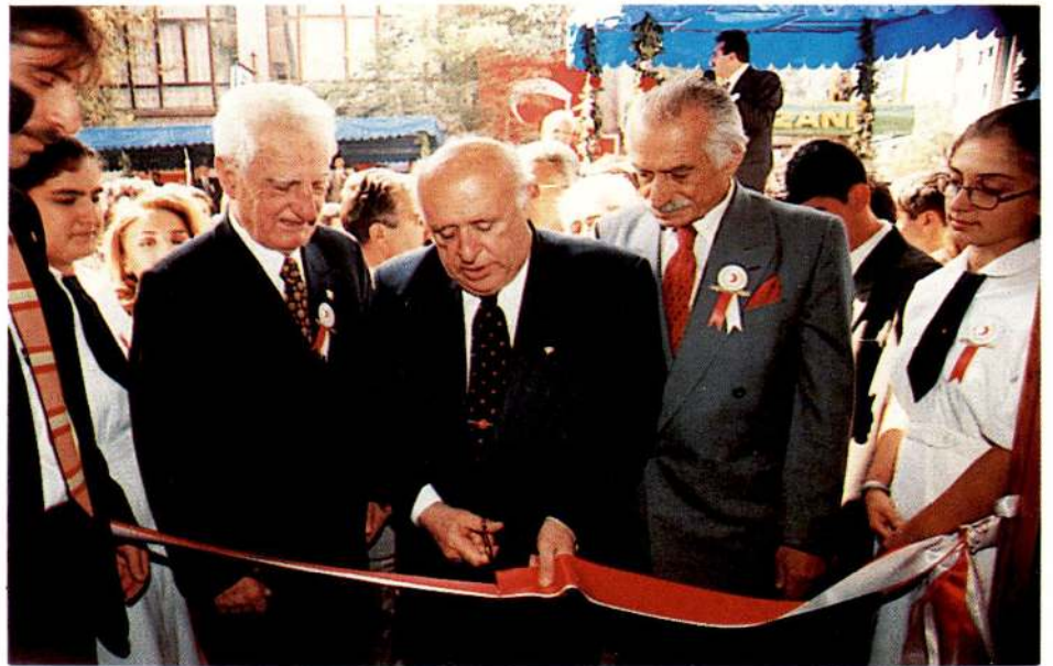
Cumhurbaşkanımız Süleyman Demirel törenden sonra Gaziosmanpaşa Dispanserimizi hizmete açtı.

İstanbul Valisi Kutlu Aktaş da açılış töreninde, Cumhurbaşkanı Süleyman Demirel tarafından açılışı yapılan 5 okulun, hayırsever kişi ve kuruluşlarca yaptı-