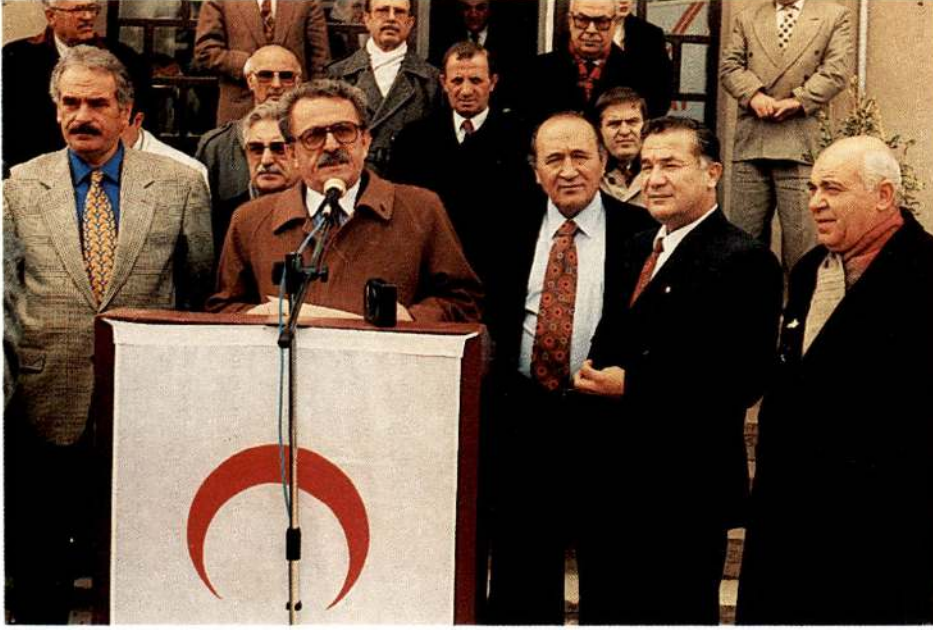
Kızılay Hac Sağlık ve Sosyal Hizmet Ekibi 21 Nisan'da törenle Suudi Arabistan'a uğurlandı.