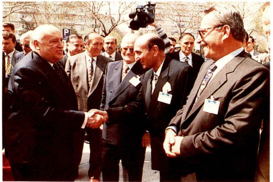
Cumhurbaşkanı Süleyman Demirel, kendisini karşılayan Yönetim Kurulu üyelerimizin tek tek hatırını sordu.

Sayın Cumhurbaşkanım, lütfettiniz, esirgemediniz, zamanınızın taşıdığı değere rağmen, İstanbul'da Kadir-Rezan Has Tıp Merkezi'ni kısa bir süre önce