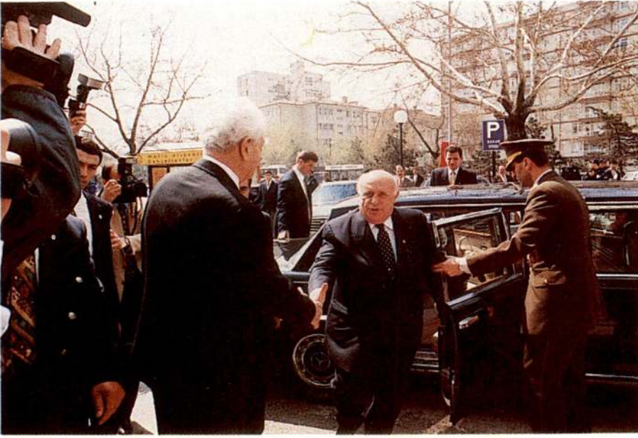
Cumhurbaşkanı Süleyman Demirel, kongre salonuna gelişinde büyük sevgi gösterileriyle karşılandı.

tarafından karşılanan Cumhurbaşkanı Süleyman Demirel 'e kongre salonunda büyük sevgi gösterisinde bulunuldu. Cumhurbaşkanı Demirel 'in salondaki yerini almasından sonra topluca İstiklal Marşı söylendi ve Büyük Atatürk , şehitlerimiz ve merhum Kızılaycılar için saygı duruşunda bulunuldu.