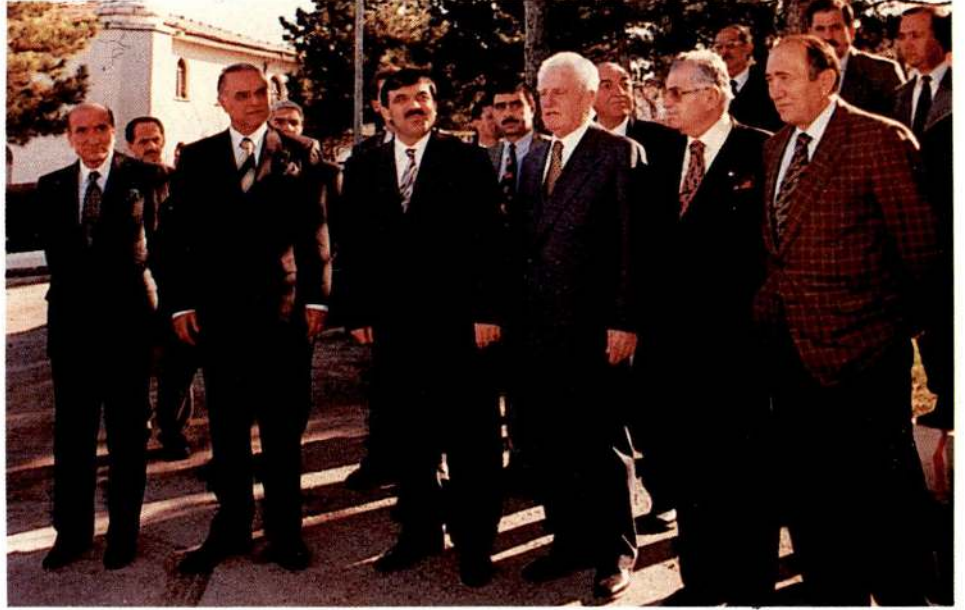
Yardım konvoyu törenle Bulgaristan'a uğurlandı.

" Türkiye'nin misyonu büyüktür. Türkiye bu yardımları sadece insani amaçlarla yapmaktadır. Bugün de, uzun süredir