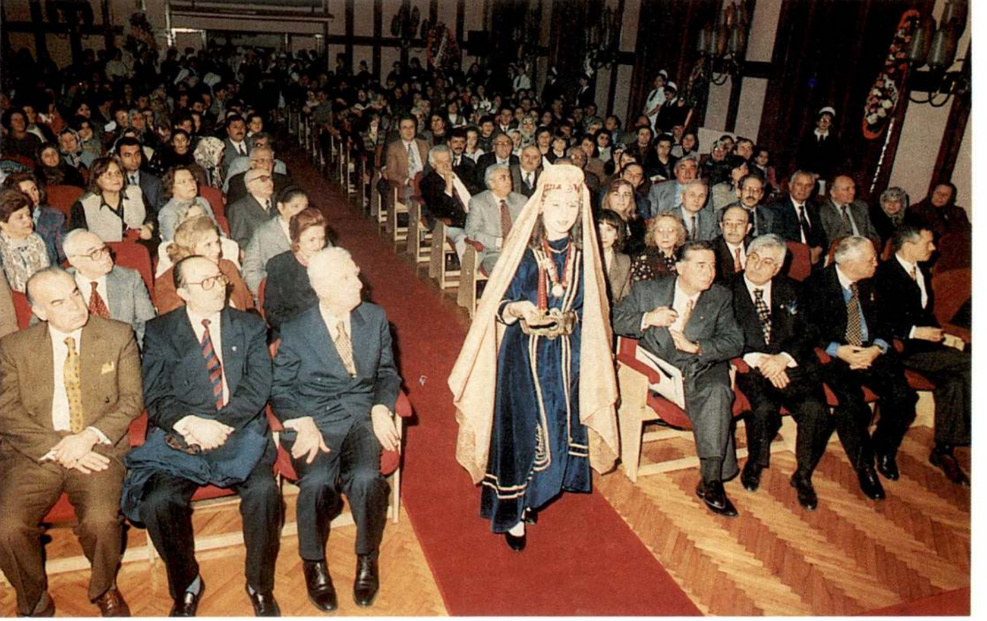
Kep giyme töreninde, bugüne kadarki hemşire kıyafetleri de sergilendi.