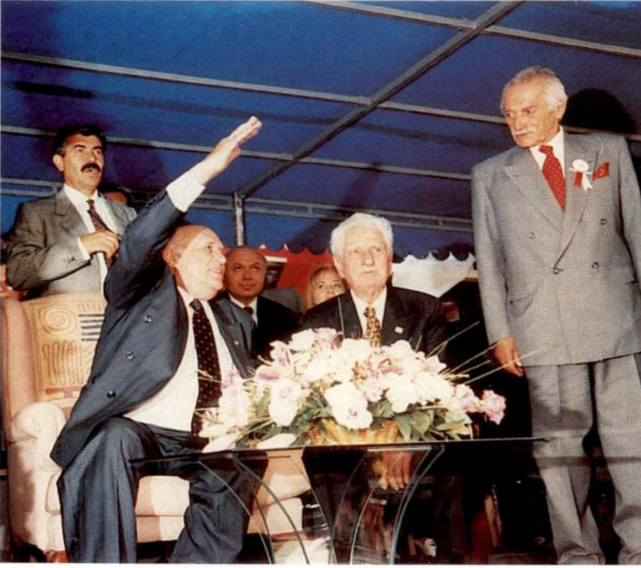
Cumhurbaşkanımız Demirel, tören alanındaki yerini almaya kadar Gaziosmanpaşalılar tarafından alkışlandı.