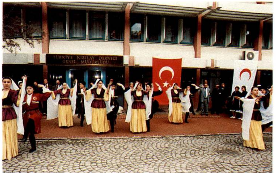
Hemşirelik Lisesi Forklor Ekibi haftanın ilk günü Genel Merkezimiz önünde bir gösteri yaptı.

Kızılay şubeleri de hafta dolayısıyla çeşitli etkinlikler düzenlediler.