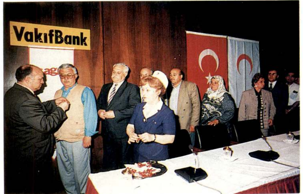
Donörlerimiz madalya ve plaketerini sırayla aldılar.

Hafta süresince çeşitli kuruluşlarımız ve üniversitemiz kan bağışı kampanyası düzenlerken, Güven Park'ta da "Okullararası Halkoyunları ve Müzik Şöleni" yapıldı.