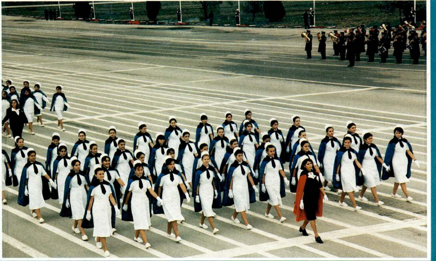
KIZILAY ÖZEL HEMŞİRELİK LİSESİ CUMHURİYET BAYRAMI'NDA