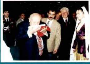
CUMHURBAŞKANI SÜLEYMAN DEMİREL:

"Türk Kızılayı köklü ve parlak bir tarihe sahip, başarıları her zaman milletimiz için iftihar vesilesi olmuş, dünya ölçüsünde tecrübe sahibi müstesna bir kuruluşumuzdur."