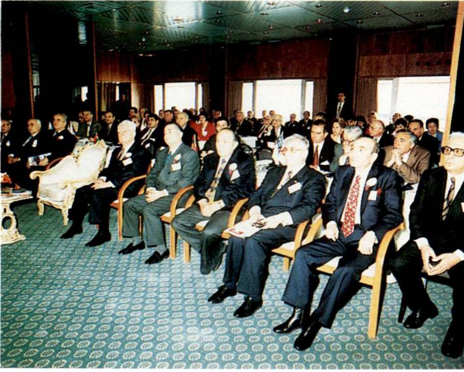
Cumhurbaşkanı Süleyman Demirel'in konuşması katılımcılar tarafından ilgiyle dinlendi.

toplantının çok isabetli bir teşebbüs olduğunu düşünüyorum. Bu bağlamda üye ülke derneklerinin, doğal afetlerde zarar görenlere felaket anında daha süratli yardımda bulunabilmesini teminen, etkili bir dağıtım mekanizmasının oluşturulması birinci öncelik olmalıdır. Bu doğrultuda, Karadeniz Ekonomik İşbirliği üyesi ülkelerin ulusal Kızılay ve Kızılhaç derneklerinin ortak yardım ve destek mekanizmaları kurmaları fikrinin süratle hayata geçirilmesine önem vermekteyiz.