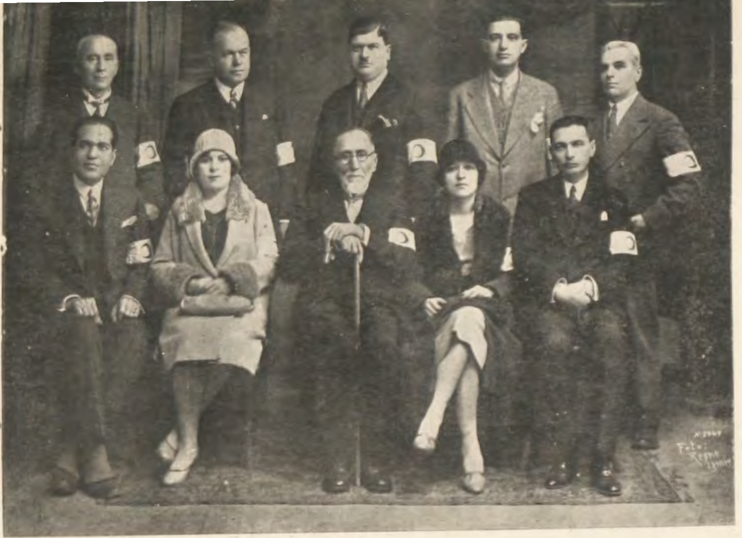
İzmir Hilâliahmer Heyeti merkeziyesi