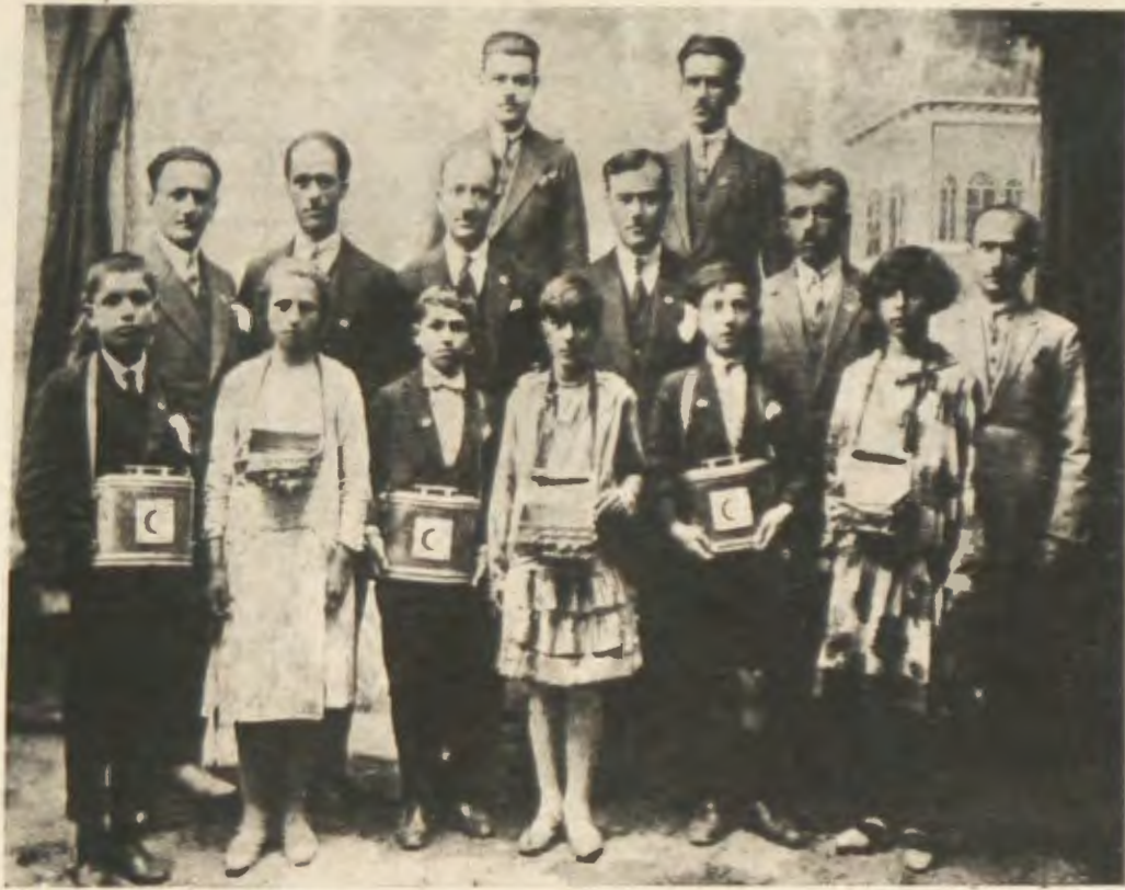
Merzifonda Rozet tevziinde heyeti faale