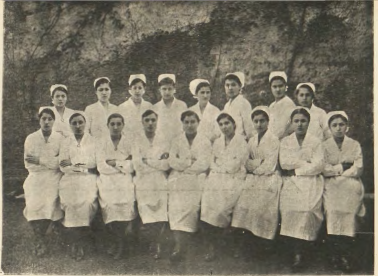
Hilaliahmer Hastabakıcı Mektebi 1930 mezunları